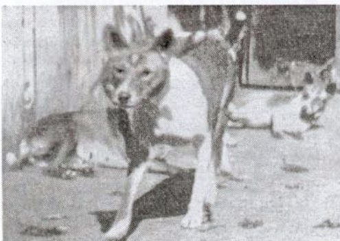
Kongonkoiria Berliinin eläintarhassa 1905.

Vuonna 1905 otetussa kuvassa näkyy kolme näistä tuonneista.